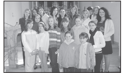
Boží šramot, Kvetná nedeľa 2007